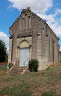
Église de Prailles