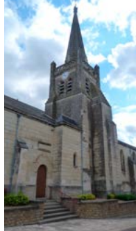
Église de Bouillé-Loretz