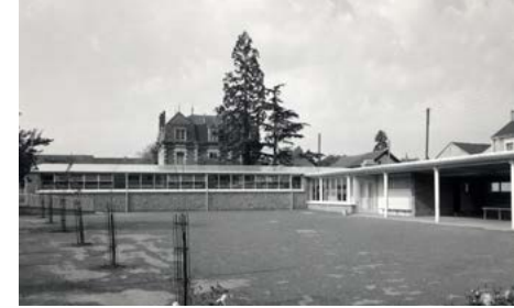
École Anatole France en 1956