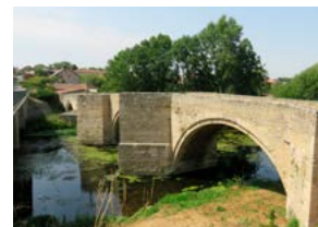
Pont de Saint-Généroux