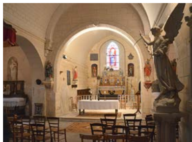
Chœur de l'église Sainte-Radegonde

dimanche 10h-12h et 14h30-18h30 Visites guidées avec les bénévoles de l'atelier archéologie du Centre Socio Culturel du Thouarsais.