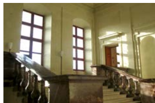
Escalier d'honneur du château