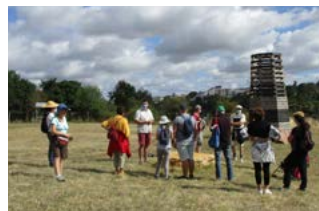
Trois voix, un parcours