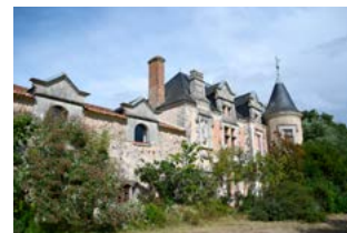
Château Les Blancharderies

l'église et du château ( parcours d'interprétation ).