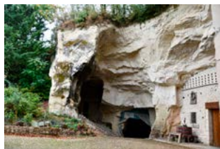
Les troglodytes de Tourtenay

couvrez les richesses des sols agricoles et remportez des cadeaux. Les acteurs agricoles locaux ( agriculteurs, Groupe Sol Vivant, Chambre d'agriculture, ACE méthanisation, Communauté de communes du Thouarsais ) mènent de nombreux projets afin de faire évoluer les pratiques, augmenter le stockage carbone, favoriser les auxiliaires de cultures, produire de l'énergie... Ils seront présents pour répondre à vos questions, vous faire pénétrer au cœur du sol et vous aider à résoudre les énigmes du labyrinthe.