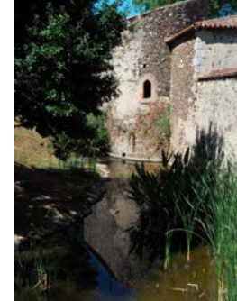
Château de la Garenne

en eau toute l'année, de son parc aux arbres centenaires, de son four à pain et pâtisserie et enfin de ses pannes dans les caves. Ouverture exceptionnelle.