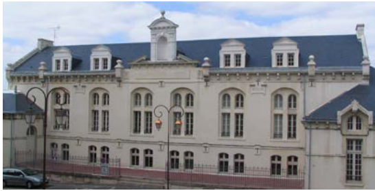
Ancienne école Jules Ferry Institut de Formation en Soins Infirmiers