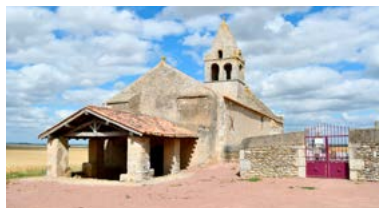
Église Saint-Martin-Les-Baillargeaux (Noizé)

Balade patrimoine et lecture organisée par l'Association des Amis d'Oiron. Cette sortie pédestre en milieu naturel, commentée par une guide conférencière et ponctuée d'interventions d'un groupe de lectures de textes littéraires, commencera par le Clos de Bel Air avec sa vigne et ses pavillons privés, puis se poursuivra par les réputées Fontaines de Bilazais et l'histoire de leurs eaux sulfureuses, et se