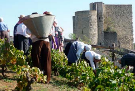
Vigne du Vieux Thouars, clos Pascreau-Lemiale