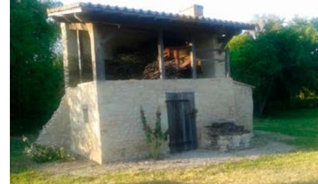
Four à pain de Marnes