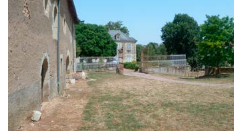
Vestiges de l'abbaye Saint-Jean-de-Bonneval

15h et 17h : Venez écouter les voix du trio Hays, Le Corre et Bitton qui vous