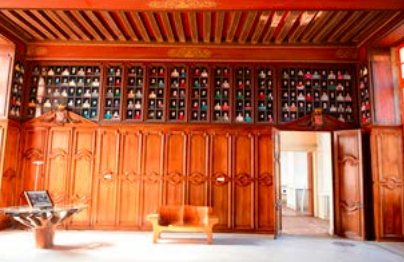
Galerie de portraits, Les Écoliers d'Oiron Collection Curios et Mirabilia