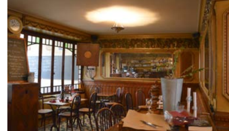
Intérieur du Café des Arts